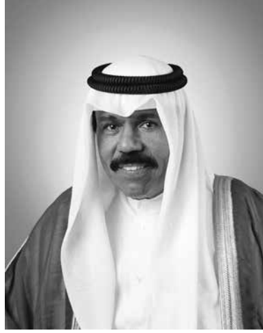
سمو الشيخ نواف الأحمد الجابر الصباح ولي عهد دولة الكويت