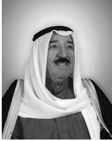
صاحب السمو الشيخ صباح الأحمد الجابر الصباح أمير دولة الكويت