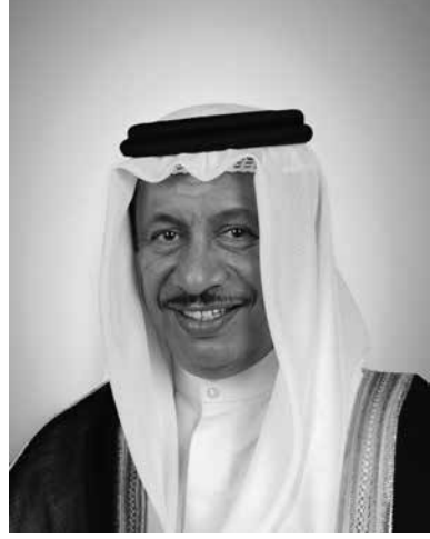
سمو الشيخ جابر المبارك الحمد الصباح رئيس مجلس الوزراء - دولة الكويت