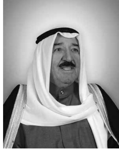
السمو الشيد يا الأ م الجابر اليا أمير دولة الكويت